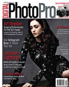
Digital Photo Pro Magazine

“Avancerade möjligheter med enkelhet att skapa online album”